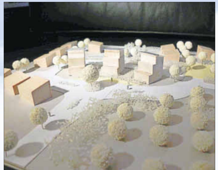
Blick von Südwest