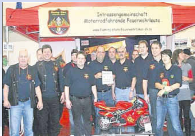
Interessengemeinschaft Motorradfahrende Feuerwehrleute

ab 10:00 Uhr Frühschoppen und Mittagessen mit Ochs am Speiß begleitet von der Klützer Feuerwehrkapelle und der Band „Two Country Man“