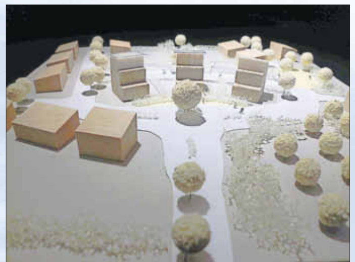
Blick von West nach Ost