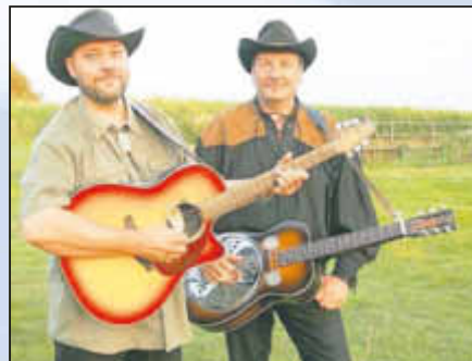
Line Dance Party mit DJ Richie

Ankunft der Flaming Stars DJ Richie Auftritt der Selmsdorfer „Line Dance Kids“ Workshop für Kinder Auftritt des „Selmsdorfer Line Dance e. V.“